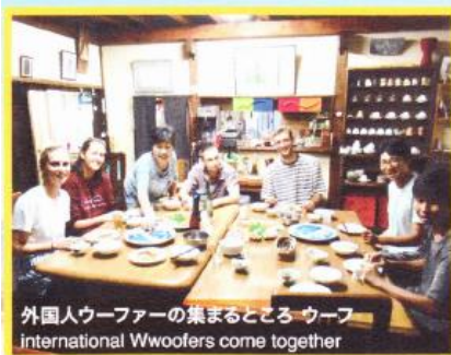
外国人ウーファーの集まるどころ ウーフ international Wwoofers come together